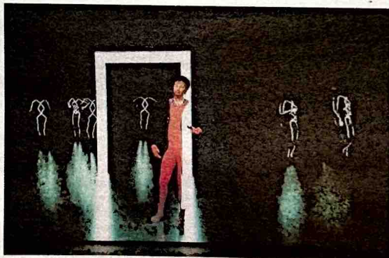
Mitä? Sehän olen minä, mutta en sittenkään. Ensireaktio oman kaksoisolennon ilmestyessä portista esiin on ilahtunut kauhistus.