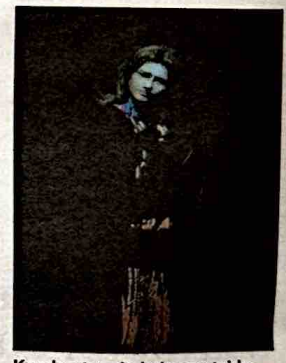
Kuuden tunnin kuluttua taideteoksessa erottaa omista kasvoistaan enää pieniä vihjeitä.

Palaan kuuden tunnin kuluttua tarkistamaan, kuinka paljon perheeni on ehtinyt kasvaa. Hahmoissa näkyy enää vihjeitä kasvoistani. Parhaiten tunnistan omat kaukaiset sukulaiseni täh-